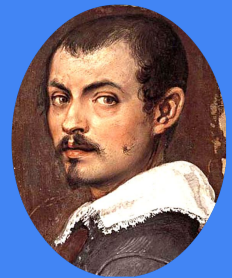
LICEI GIOVANNI DA SAN GIOVANNI

FLIPPED CLASSROOM: L'insegnamento capovolto fa leva sul fatto che le competenze cognitive di base dello studente (ascoltare, memorizzare) possono essere attivate prevalentemente a casa, in autonomia, apprendendo attraverso video e podcast, o leggendo i testi proposti dagli insegnanti o condivisi da altri docenti. In classe, invece, possono essere attivate le competenze cognitive alte (comprendere, applicare, valutare, creare) poiché l'allievo non è solo e, insieme ai compagni e all'insegnante al suo fianco, cerca, quindi, di applicare quanto appreso per risolvere problemi pratici proposti dal docente.